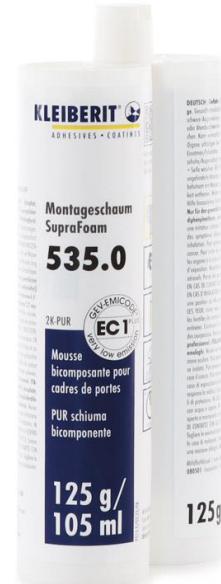
KLEIBERIT 535.0 SupraFoam in der Doppelkartusche